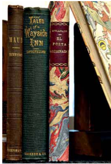
A l'Eixample dret hi trobem els Balaguer, uns antiquaris de llibres que porten en el negoci des del 1923. Allà, amagats entre prestatges, hi reposen autèntiques meravelles, com un llibre de les hores holandès del segle XIV i valorat en 20.000 euros.

A la rebotiga de la Vila Viniteca hi ha moltes delicadeses. A la foto, ampolla de vi Château Mouton Rothschild 1945 (8,475 €), llauna de cloïsses La Brújula (65,50 €) i llauna de caviar Kaspia, beluga iraniana (1.086 €).