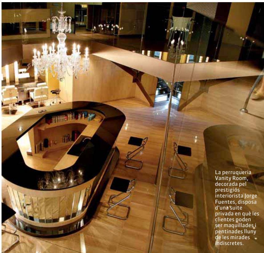
La perruqueria Vanity Room, decorada pel prestigiós interiorista Jorge Fuentes, disposa d'una suite privada en què les clientes poden ser maquillades i pentinades lluny de les mirades indiscretas.

passar per la cuina, arribem a aquest restaurant en què es degusten autèntiques delicadeses. Quan parlem de delicadeses tampoc no podem obviar establiments com la Vila Viniteca ( www.vilaviniteca.es ), que, al rebost, hi amaga meravelles de la gastronomia com una llauna del millor caviar Kaspia, de beluga iraniana (a 1.086 € la llauna de 100 g) o una ampolla de Château Mouton Rothschild 1945, que costa 8.475 €, només aptes per a paladars milionaris.