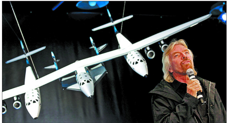
Richard Branson, en la presentación de la aeronave.

"Esto no será sólo llevar a gente al espacio, creo que va a haber una gran transformación, estoy convencido de que ver el planeta desde fuera puede hacer ver la necesidad de protegerlo", explicó ayer Branson, junto a la maqueta de la nueva nave espacial de su compañía Virgin Galactic. Diseñada por Burt Rutan, tendrá casi 18 metros, capacidad para seis pasajeros, y volará unida a una nave nodriza, White Knight Two , hasta alcanzar los 15 kilómetros de altura. Será entonces cuando la nave espacial saldrá propulsada hasta alcanzar los 110 metros de altura y permanecer esos cinco minutos flotando en el espacio. Algunos de los españoles que se