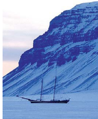
A la izquierda, nave nodriza y cohete SpaceShipTwo; a la derecha, el Ártico como destino exclusivo.